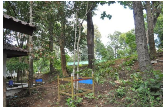
ภาพที่ ๒๘ ลำต้น