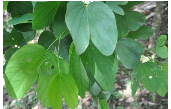
ภาพที่ ๓๒ ใบ