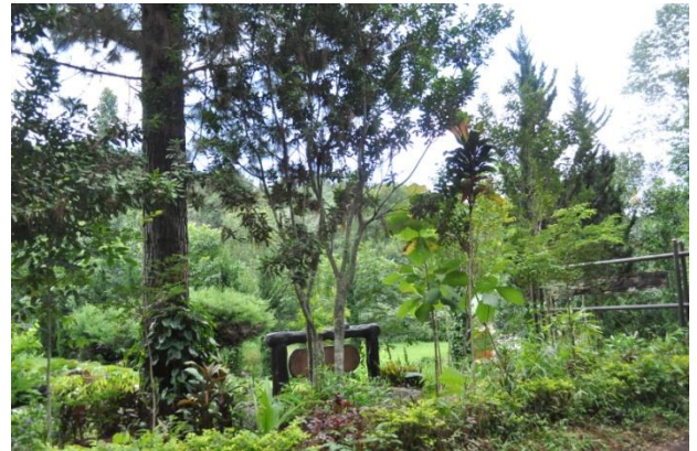
ภาพที่ ๕๖ ภูมิทัศน์รอบต้นไม้

หมายเหตุ เจ้าหน้าที่ฝ่ายอารักขาพันธุ์ไม้ป่า ตรวจสอบปลวกทำรังและกินรากทั้ง ๒ ต้น