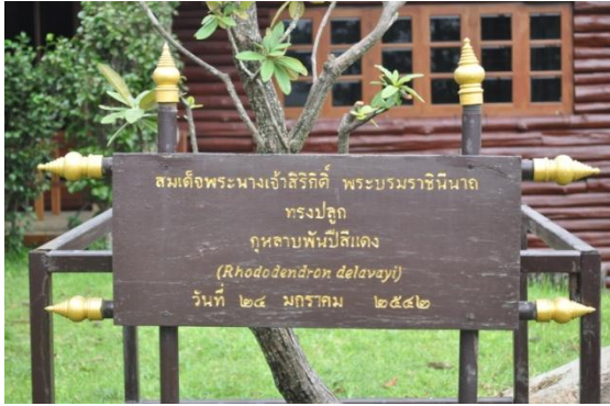
ภาพที่ ๒ ป้ายชื่อผู้ทรงปลูก ชื่อพรรณไม้ และเสารอบต้นไม้

๑.๑ สมเด็จพระนางเจ้าฯ พระบรมราชินีนาถ ทรงปลูกต้นกุหลาบพันปี (สีแดง) จำนวน ๑ ต้น เมื่อวันที่ ๒๔ มกราคม ๒๕๕๒ บริเวณหน้าพระตำหนักดอยผาตั้ง