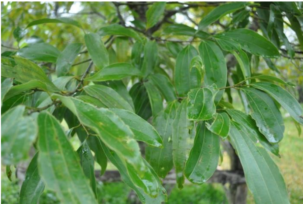
ภาพที่ ๑๗ ใบ