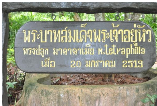
ภาพที่ ๕๐ ป้ายชื่อผู้ทรงปลูกและชื่อต้นไม้