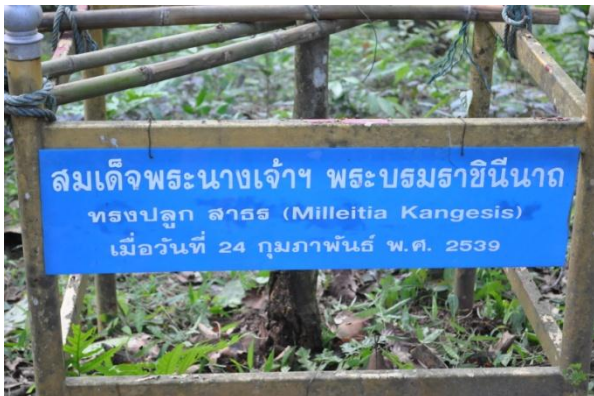
ภาพที่ ๓๔ ป้ายชื่อผู้ทรงปลูกและชื่อต้นไม้

๔.๓ สมเด็จพระนางเจ้าฯ พระบรมราชินีนาถ ทรงปลูกต้นสาธรร จำนวน ๑ ต้น เมื่อวันที่ ๒๔ กุมภาพันธ์ ๒๕๓๙ ในพื้นที่สถานีควบคุมไฟฟ้าเชียงใหม่ (ภูพิงค์เดิม)