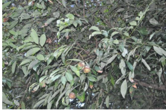
ภาพที่ ๔๖ ใบ