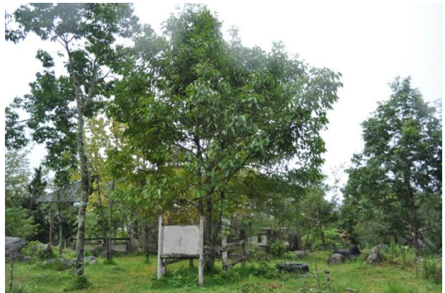
ภาพที่ ๑๘ ภูมิทัศน์รอบบริเวณต้นไม้

๓.๒ สมเด็จพระนางเจ้าฯ พระบรมราชินีนาถ ทรงปลูกต้นชมพูพิกัด (สีแดง) จำนวน ๑ ต้น บริเวณบริเวณพื้นที่โครงการอนุรักษ์พันธุกรรมกล้วยไม้รองเท้านารีอินทนนท์