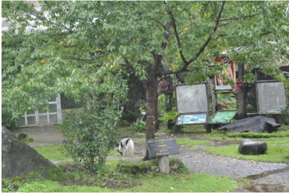
ภาพที่ ๒๐ ลำต้น