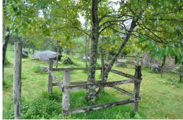
ภาพที่ ๑๖ ลำต้น