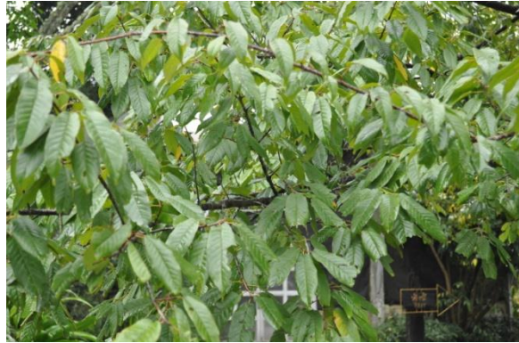
ภาพที่ ๒๑ ใบ