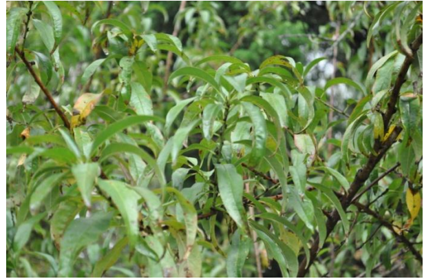
ภาพที่ ๑๒ ใบ