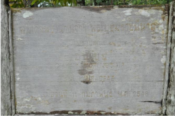
ภาพที่ ๑๕ ป้ายชื่อผู้ทรงปลูกและชื่อต้นไม้

๓.๑ สมเด็จพระนางเจ้าฯ พระบรมราชินีนาถ ทรงปลูกต้นอบเชย จำนวน ๑ ต้น เมื่อวันที่ ๑๑ กุมภาพันธ์ ๒๕๔๘ บริเวณพื้นที่โครงการอนุรักษ์พันธุกรรมกล้วยไม้รองเท้านารีอินทนนท์