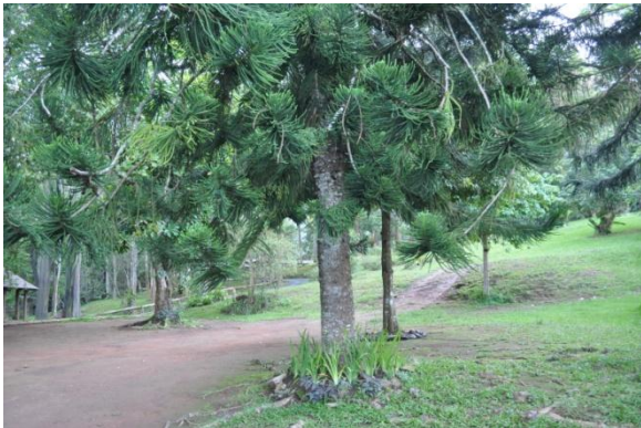
ภาพที่ ๓๙ ลำต้น