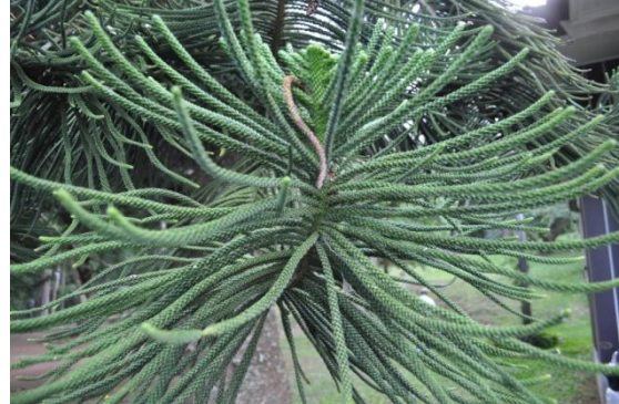
ภาพที่ ๔๓ ใบ