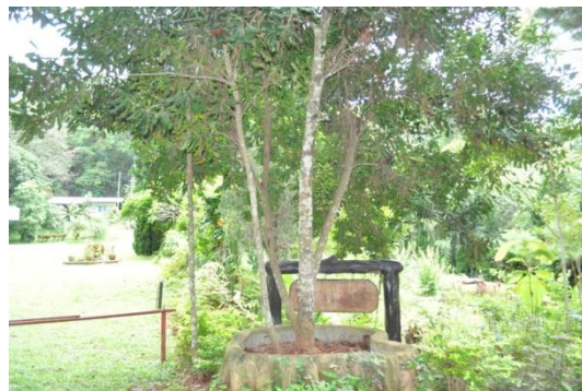
ภาพที่ ๕๑ ลำต้น