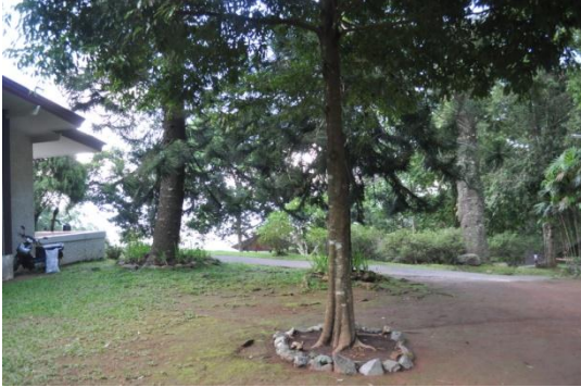
ภาพที่ ๔๕ ลำต้น

๕.๓ สมเด็จพระเทพรัตนราชสุดาฯ สยามบรมราชกุมารี ทรงปลูกต้นบอนนาค จำนวน ๑ ต้น เมื่อวันที่ ๒ มีนาคม ๒๕๑๘ บริเวณบ้านพักอุทยานแห่งชาติดอยสุเทพ-ปุย อ.เมือง จ.เชียงใหม่