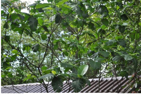
ภาพที่ ๒๙ ใบ