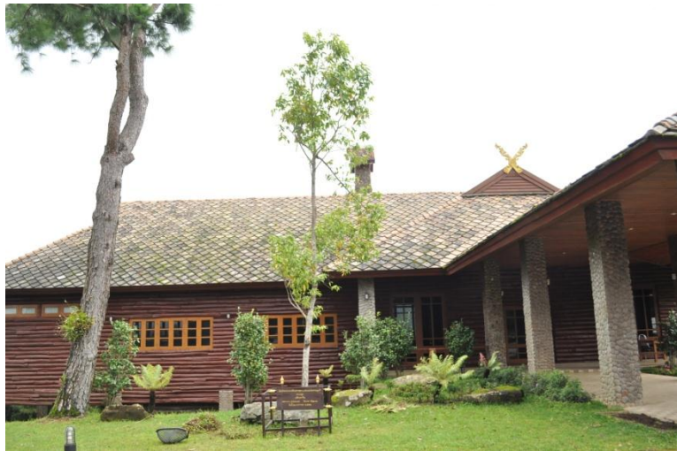
ภาพที่ ๙ ภูมิทัศน์รอบบริเวณต้นไม้

๒. โรงไฟฟ้าบ้านขุนกลาง อ.จอมทอง จ.เชียงใหม่ สมเด็จพระเทพรัตนราชสุดาฯ สยามบรมราชกุมารี ทรงปลูกต้นท้อ จำนวน ๑ ต้น บริเวณหน้าโรงไฟฟ้าบ้านขุนกลาง