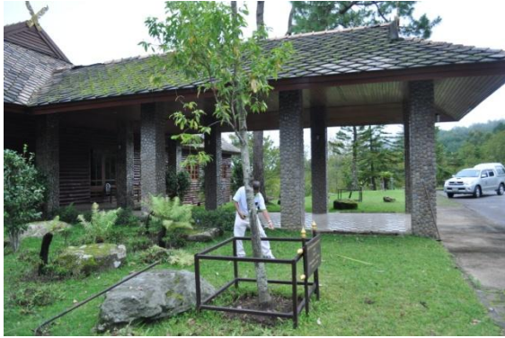
ภาพที่ ๗ ลำต้น