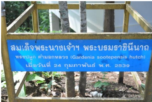
ภาพที่ ๒๗ ป้ายชื่อผู้ทรงปลูกและชื่อต้นไม้

๔.๒ สมเด็จพระนางเจ้าฯ พระบรมราชินีนาถ ทรงปลูกต้นค้ำอกหลวง จำนวน ๑ ต้น เมื่อวันที่ ๒๔ กุมภาพันธ์ ๒๕๓๙ ในพื้นที่สถานีควบคุมไฟฟ้าเชียงใหม่ (ภูฝิงค์เดิม)