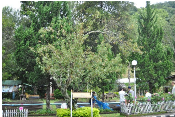
ภาพที่ ๑๓ ภูมิทัศน์รอบบริเวณต้นไม้

๓. โครงการอนุรักษ์พันธุ์กล้วยไม้รองเท้านารีอินทนนท์ จ.เชียงใหม่ มีต้นไม้ทรงปลูก จำนวน ๒ ต้น