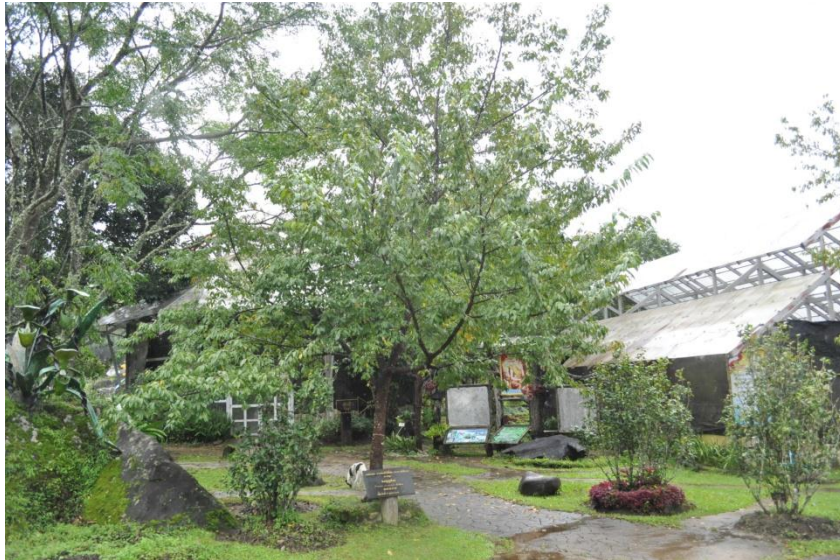
ภาพที่ ๒๒ ภูมิทัศน์รอบบริเวณต้นไม้