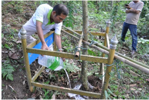
ภาพที่ ๓๘ เจ้าหน้าที่ฝ่ายอารักขาพันธุ์ไม้ป่า ใช้สารเคมีคลอรีนฟอสเฟตผสมน้ำรดที่บริเวณโคนต้นสาธร