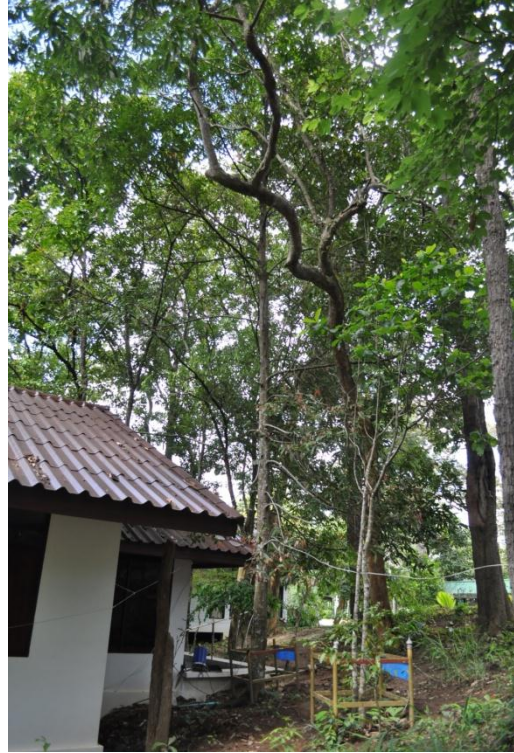
ภาพที่ ๒๖ ภูมิทัศน์รอบบริเวณต้นไม้

๔.๒ สมเด็จพระนางเจ้าฯ พระบรมราชินีนาถ ทรงปลูกต้นค้ำอกหลวง จำนวน ๑ ต้น เมื่อวันที่ ๒๔ กุมภาพันธ์ ๒๕๓๙ ในพื้นที่สถานีควบคุมไฟฟ้าเชียงใหม่ (ภูฝิงค์เดิม)