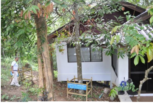
ภาพที่ ๒๕ ลำต้น