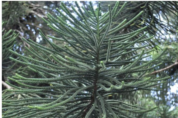
ภาพที่ ๔๐ ใบ