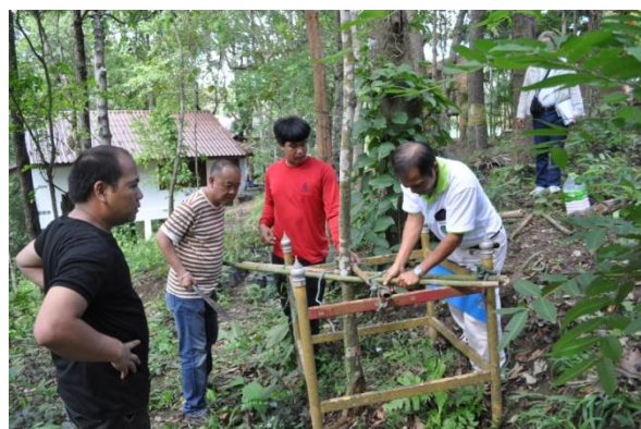
ภาพที่ ๓๗ เจ้าหน้าที่กำลังปรับตั้งต้นไม้ตรง เนื่องจากต้นสาธรรถูกปลวกกัดกินรากและโคนต้น ทำให้ต้นล้มเอน