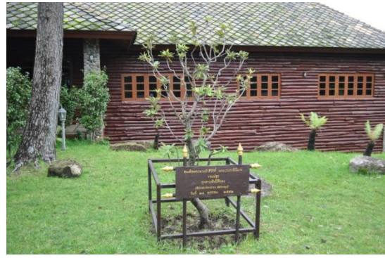
ภาพที่ ๕ ภูมิทัศน์รอบบริเวณพรรณไม้

๑.๒ สมเด็จพระเทพรัตนราชสุดาฯ สยามบรมราชกุมารี ทรงปลูกต้นแก้วมหาวัน จำนวน ๑ ต้น เมื่อวันที่ ๒๔ มกราคม ๒๕๕๒ บริเวณหน้าพระตำหนักดอยผาตั้ง