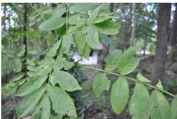
ภาพที่ ๓๖ ใบ