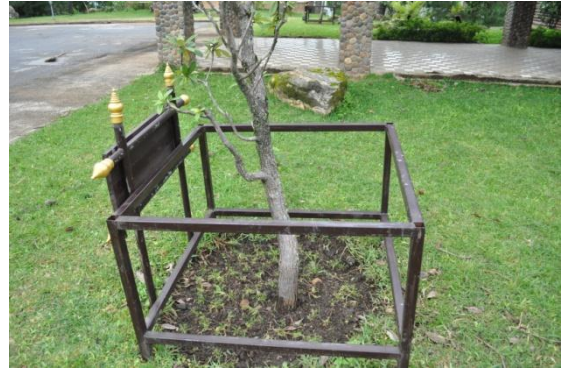
ภาพที่ ๓ ลำต้น