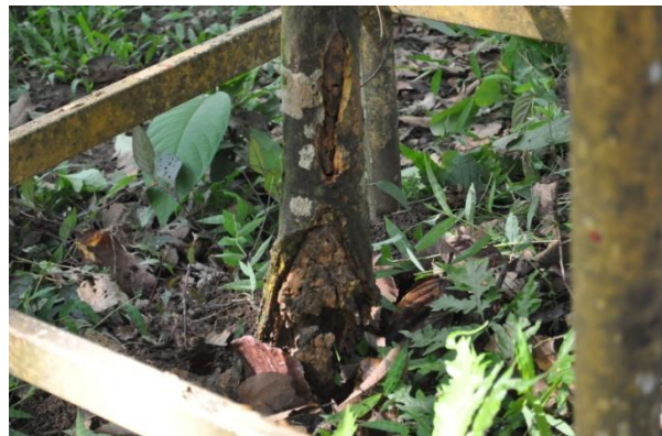
ภาพที่ ๓๕ ปลวกกัดกินโคนต้นสาธรร