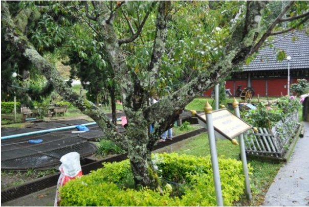
ภาพที่ ๑๑ ลำต้น