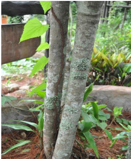
ภาพที่ ๕๕ โคนต้นไม้มีปลวกทำรังและกินราก