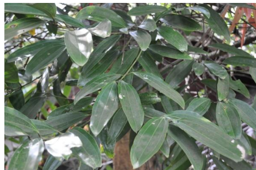
ภาพที่ ๒๔ ใบ