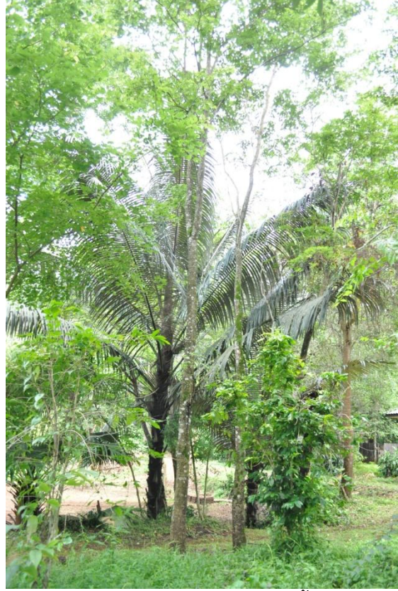
ภาพที่ ๖๐ ภูมิทัศน์รอบบริเวณต้นเสี้ยวดอกขาว