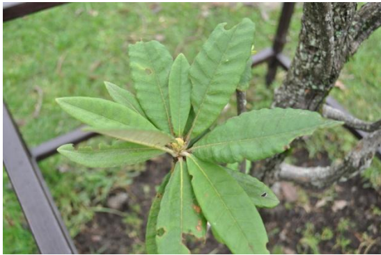
ภาพที่ ๔ ใบต้นกุหลาบพันปีสีแดง