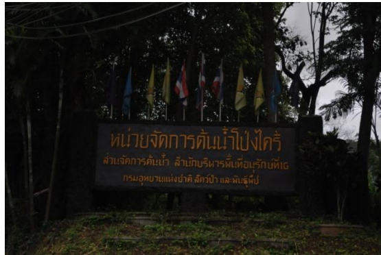
ภาพที่ ๔๙ ป้ายชื่อหน่วยจัดการต้นน้ำโปรงไคร้

๗.๑ พระบาทสมเด็จพระเจ้าอยู่หัวฯ ทรงปลูกต้นมะคาเดเมียนี้ท จำนวน ๑ ต้น เมื่อวันที่ ๒๐ มกราคม ๒๕๑๙ ในพื้นที่หน่วยจัดการต้นน้ำโปรงไคร้