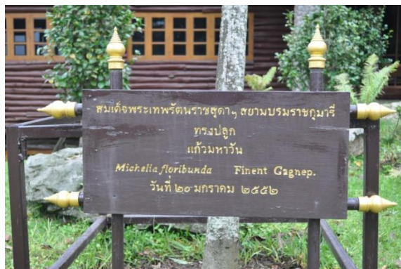
ภาพที่ ๖ ป้ายชื่อผู้ทรงปลูกและชื่อต้นไม้

๑.๒ สมเด็จพระเทพรัตนราชสุดาฯ สยามบรมราชกุมารี ทรงปลูกต้นแก้วมหาวัน จำนวน ๑ ต้น เมื่อวันที่ ๒๔ มกราคม ๒๕๕๒ บริเวณหน้าพระตำหนักดอยผาตั้ง