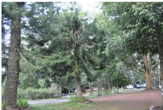
ภาพที่ ๔๑ ภูมิทัศน์รอบบริเวณต้นสนฉัตร