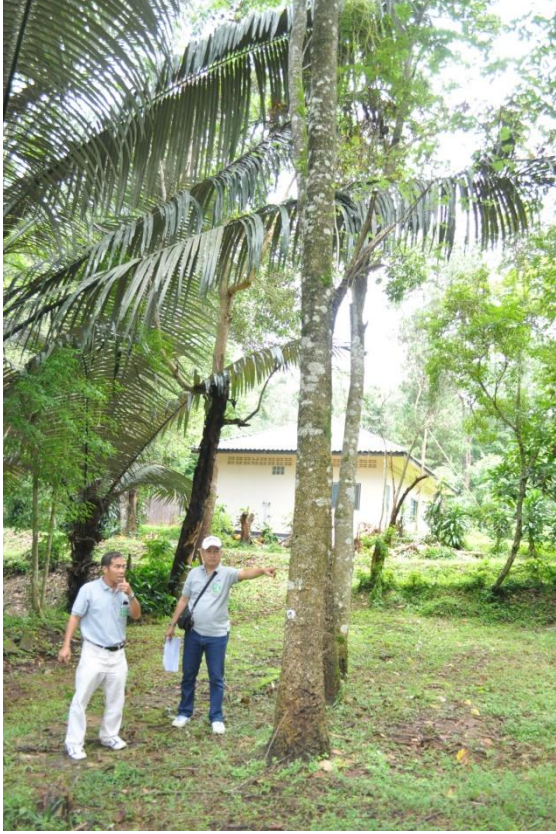
ภาพที่ ๕๙ ลำต้น

๗.๓ สมเด็จพระบรมโอรสาธิราชฯ สยามมกุฎราชกุมาร ทรงปลูกต้นเสี้ยวดอกขาว จำนวน ๑ ต้น เมื่อวันที่ ๒๒ กุมภาพันธ์ ๒๕๔๓ ในพื้นที่หน่วยจัดการต้นน้ำโปรงไคร้