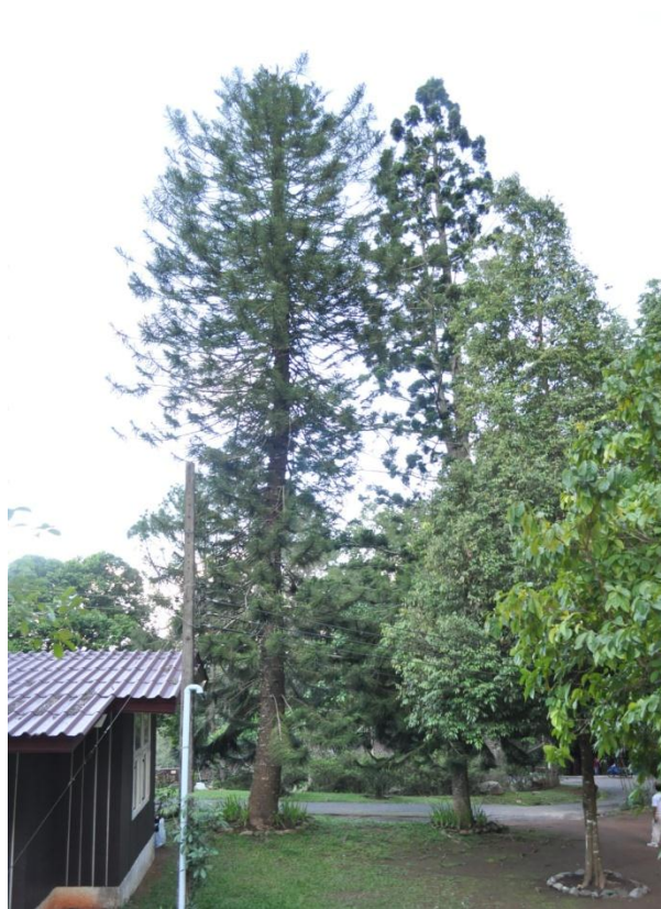
ภาพที่ ๔๔ ภูมิทัศน์รอบบริเวณต้นสนฉัตร