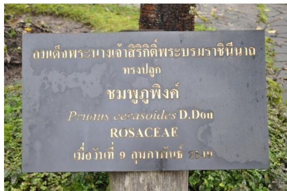
ภาพที่ ๑๙ ป้ายชื่อผู้ทรงปลูกและชื่อต้นไม้

๓.๒ สมเด็จพระนางเจ้าฯ พระบรมราชินีนาถ ทรงปลูกต้นชมพูพิกัด (สีแดง) จำนวน ๑ ต้น บริเวณบริเวณพื้นที่โครงการอนุรักษ์พันธุกรรมกล้วยไม้รองเท้านารีอินทนนท์