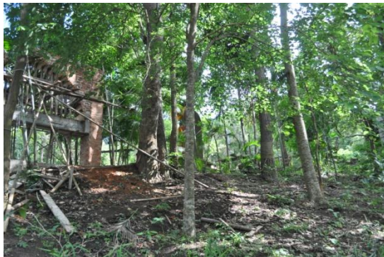
ภาพที่ ๓๑ ลำต้น (ไม่มีป้ายชื่อผู้ทรงปลูกและชื่อต้นไม้)

๔.๓ สมเด็จพระนางเจ้าฯ พระบรมราชินีนาถ ทรงปลูกต้นชงโค จำนวน ๑ ต้น เมื่อวันที่ ๒๔ กุมภาพันธ์ ๒๕๓๙ ในพื้นที่สถานีควบคุมไฟป่าเชียงใหม่ (ภูพิงค์ดิม)