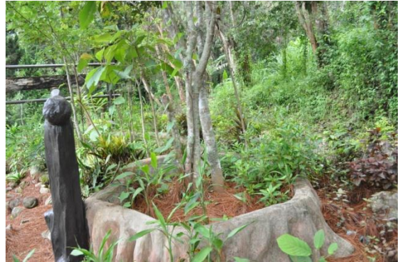
ภาพที่ ๕๔ ลำต้น