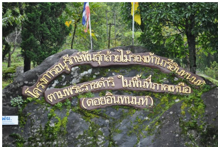
ภาพที่ ๑๔ ป้ายชื่อโครงการอนุรักษ์พันธุ์กล้วยไม้รองเท้านารีอินทนนท์

๓. โครงการอนุรักษ์พันธุ์กล้วยไม้รองเท้านารีอินทนนท์ จ.เชียงใหม่ มีต้นไม้ทรงปลูก จำนวน ๒ ต้น