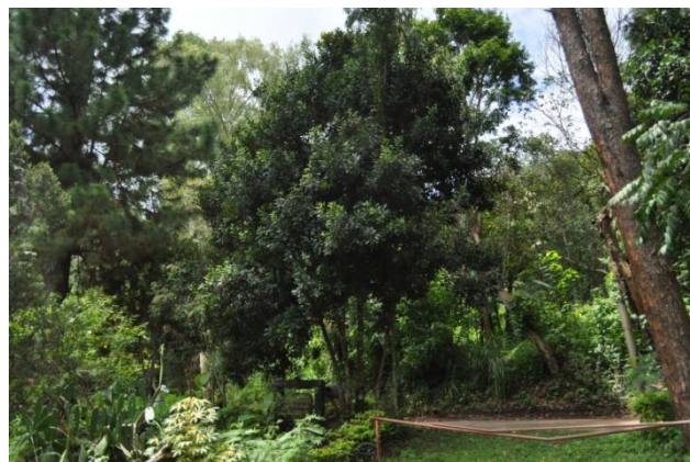
ภาพที่ ๕๒ ภูมิทัศน์รอบบริเวณต้นไม้