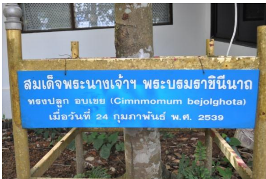
ภาพที่ ๒๓ ป้ายชื่อผู้ทรงปลูกและชื่อต้นไม้