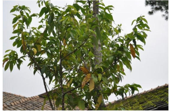
ภาพที่ ๘ ใบ