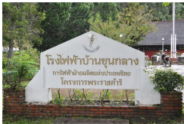
ภาพที่ ๑๐ ป้ายชื่อโรงไฟฟ้าบ้านขุนกลาง

๒. โรงไฟฟ้าบ้านขุนกลาง อ.จอมทอง จ.เชียงใหม่ สมเด็จพระเทพรัตนราชสุดาฯ สยามบรมราชกุมารี ทรงปลูกต้นท้อ จำนวน ๑ ต้น บริเวณหน้าโรงไฟฟ้าบ้านขุนกลาง