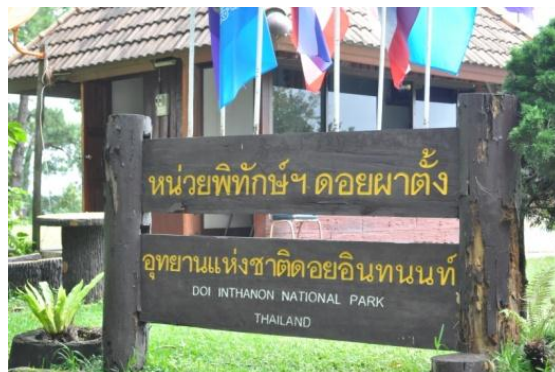
ภาพที่ ๑ ป้ายชื่อหน่วยพิทักษ์ฯ ดอยผาดั่ง อช.อินทนนท์ จ.เชียงใหม่