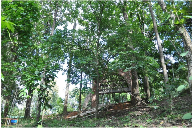
ภาพที่ ๓๓ ภูมิทัศน์รอบบริเวณต้นไม้

๔.๓ สมเด็จพระนางเจ้าฯ พระบรมราชินีนาถ ทรงปลูกต้นสาธรร จำนวน ๑ ต้น เมื่อวันที่ ๒๔ กุมภาพันธ์ ๒๕๓๙ ในพื้นที่สถานีควบคุมไฟฟ้าเชียงใหม่ (ภูพิงค์เดิม)