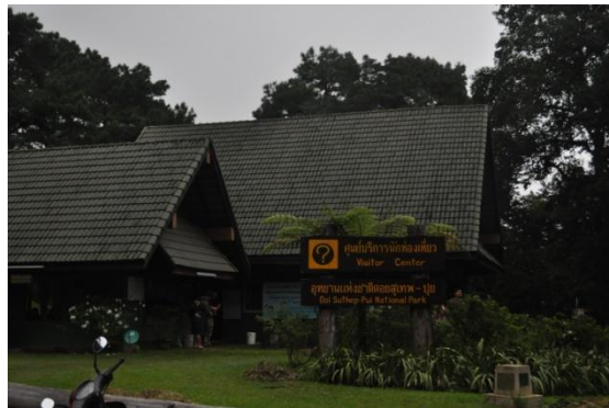
ภาพที่ ๔๘ ศูนย์บริการนักท่องเที่ยว ยอดดอยปุย

หมายเหตุ คณะเจ้าหน้าที่ไม่สามารถเดินทางไปถึงต้นไม้ทรงปลูกได้เนื่องจากมีต้นไม้หักล้มขวางทาง