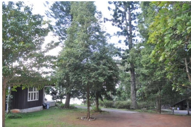
ภาพที่ ๔๗ ภูมิทัศน์รอบบริเวณต้นบอนนาค

หมายเหตุ ต้นไม้ทรงปลูกทั้ง ๓ ต้น ไม่มีป้ายชื่อผู้ทรงปลูก ชื่อต้นไม้ และเสารอบต้นไม้