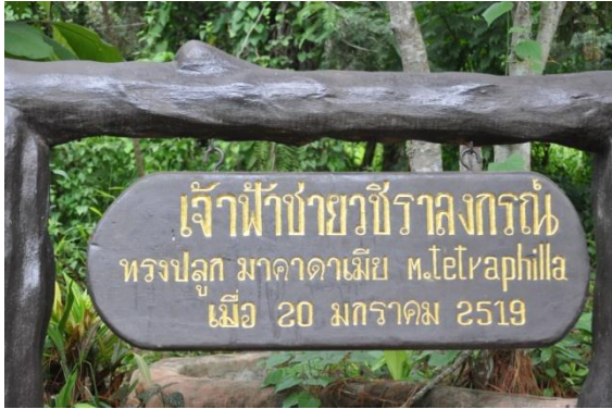
ภาพที่ ๕๓ ป้ายชื่อผู้ทรงปลูกและชื่อต้นไม้

๗.๒ สมเด็จพระบรมโอรสาธิราชฯ สยามมกุฎราชกุมาร ทรงปลูกต้นมะคาเดเมีย ๑ ต้น เมื่อวันที่ ๒๐ มกราคม ๒๕๑๙ ในพื้นที่หน่วยจัดการต้นน้ำโป่งไคร้